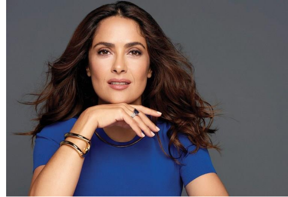
Salma Hayek , Frida , Ugly Betty / Dislexia