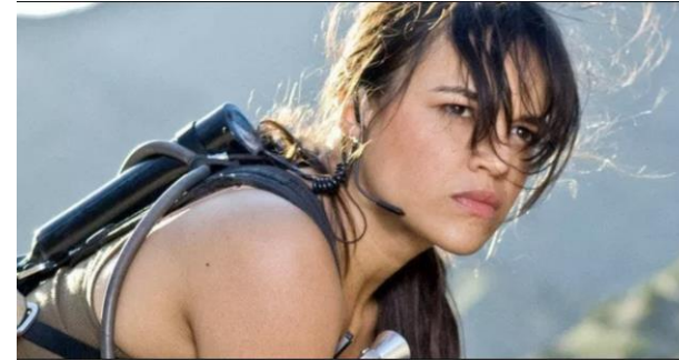
Michelle Rodriguez, Fast and Furious