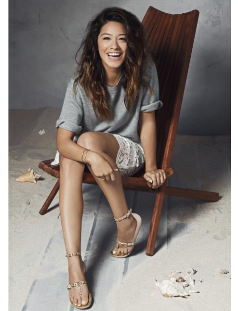
Gina Rodriguez, Jane the Virgin / Ansiedad y Hashimoto's Disease